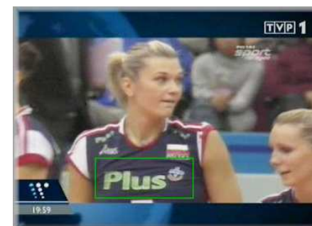
RANKING DYSCYPLIN (XI 2007)