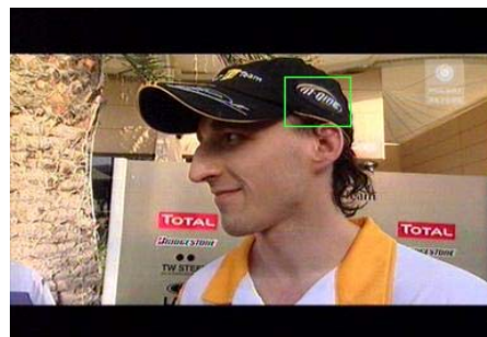
F1 - WARTOSC MEDIOWA Z OKRESU 12-15 MARCA 2010 WYBRANE MARKI